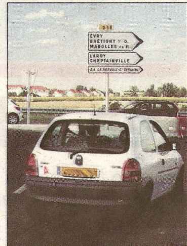
ARPAJON, VENDREDI. L'axe, fréquenté chaque jour par 25 000 à 30 000 véhicules, permet d'éviter un détour par la N 20, l'échangeur de Linas et la N 104.

Le chantier n'est pas totalement clos. Il reste à achever les 10 km de pistes cyclables, les 8 km de chemins agricoles et les aménagements paysagers qui embelliront le tout. Fin